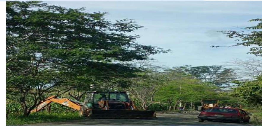
VÍA MERO SECO-LAS PAMPAS-PIÑAS